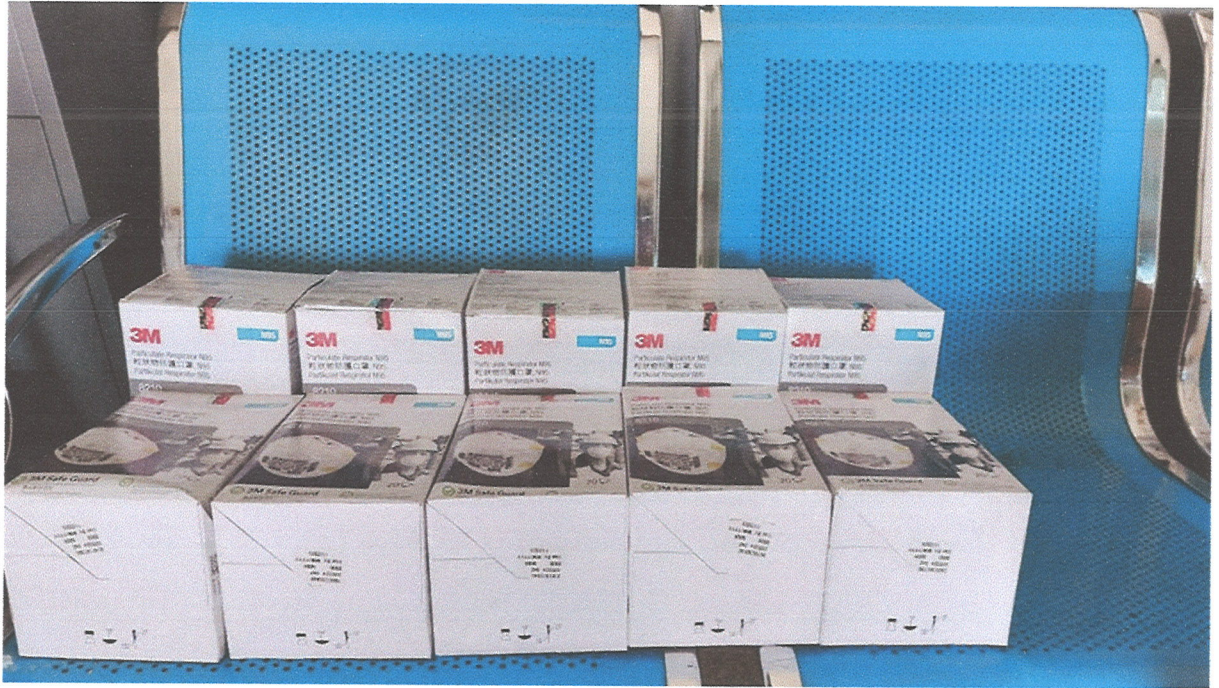
ภาพที่ ๑๑ ภาพหน้ากาก N ๙๕