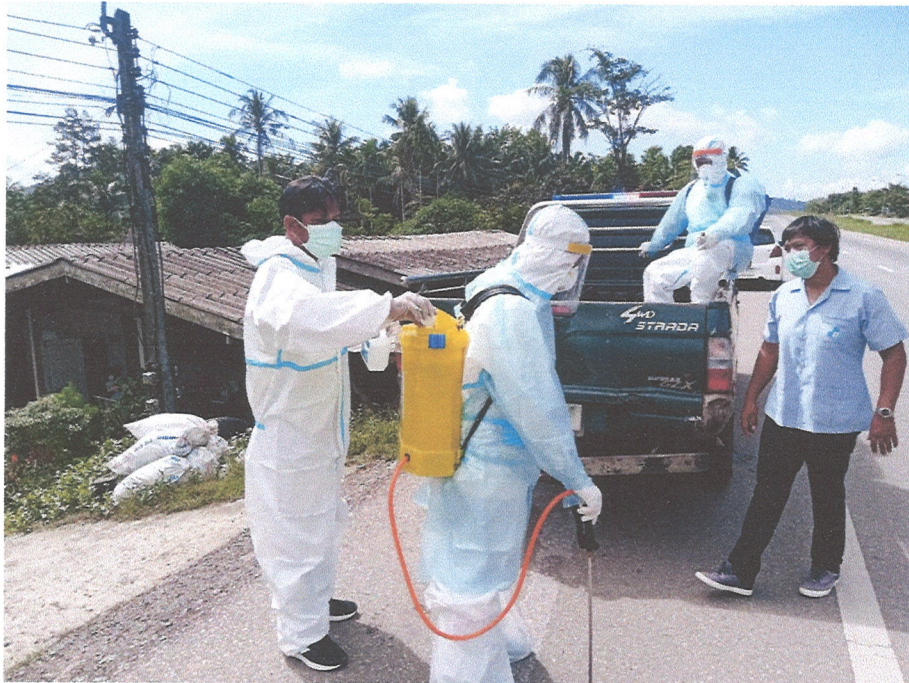
ภาพที่ ๒ ภาพการพ่นน้ำยาฆ่าเชื้อโควิด-๑๙