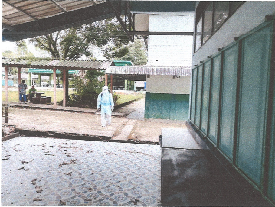
ภาพที่ ๑ ภาพการพ่นน้ำยาฆ่าเชื้อโควิด-๑๙