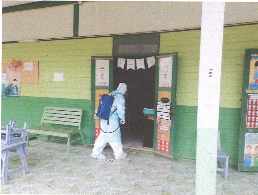
ภาพที่ ๕ ภาพการพ่นน้ำยาฆ่าเชื้อโควิด-๑๙