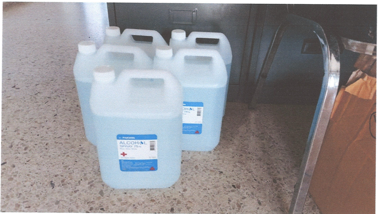
ภาพที่ ๘ ภาพแอลกอฮอล์