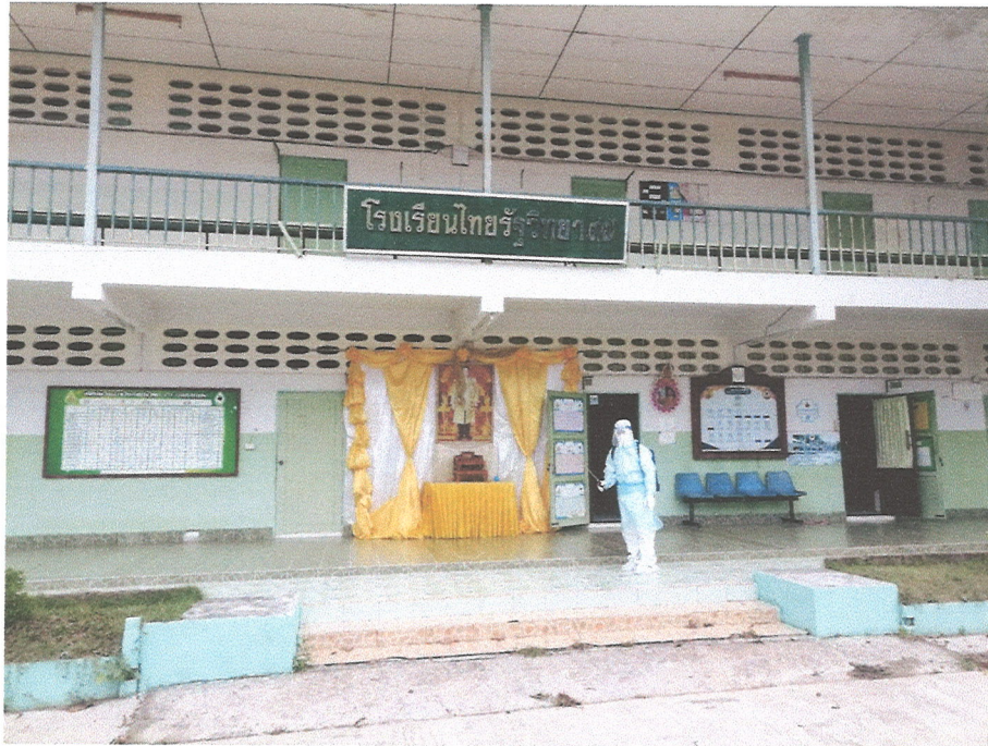
ภาพที่ ๓ ภาพการพ่นน้ำยาฆ่าเชื้อโควิด-๑๙