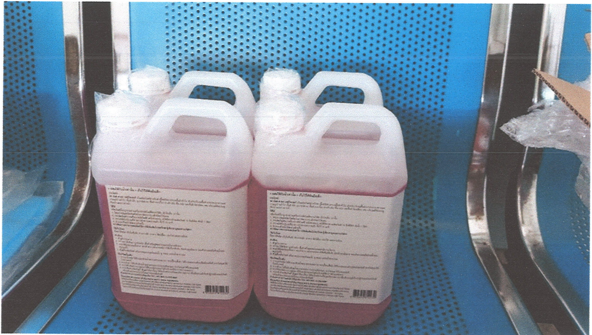
ภาพที่ ๙ ภาพน้ำยาฆ่าเชื้อ