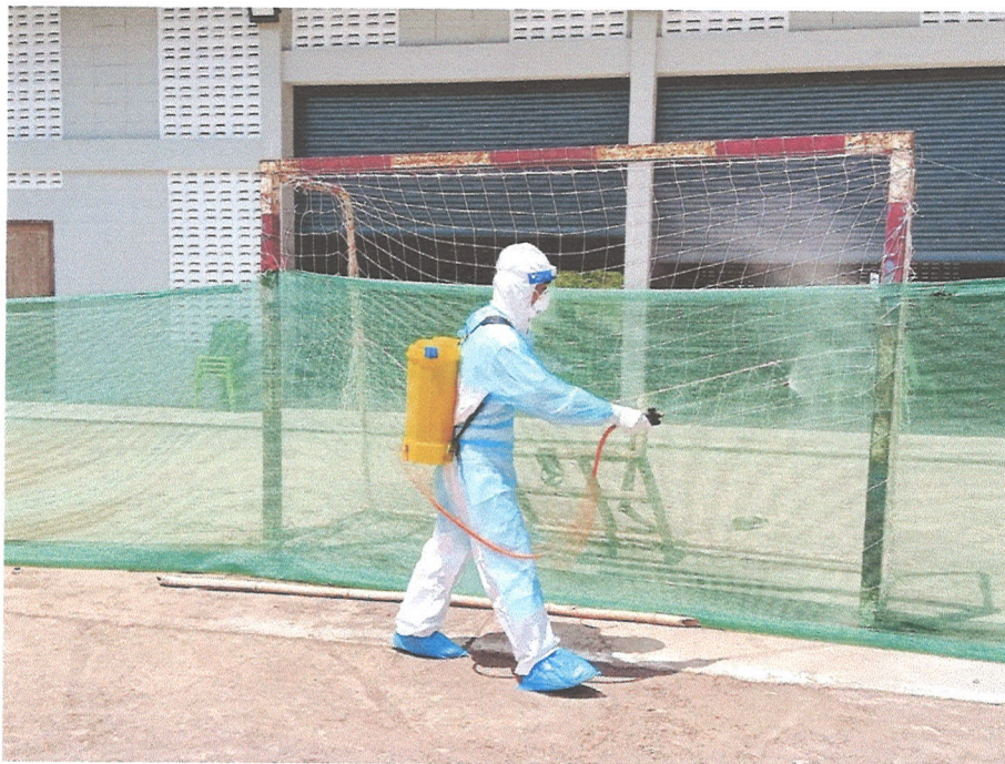
ภาพที่ ๖ ภาพการพ่นน้ำยาฆ่าเชื้อโควิด-๑๙