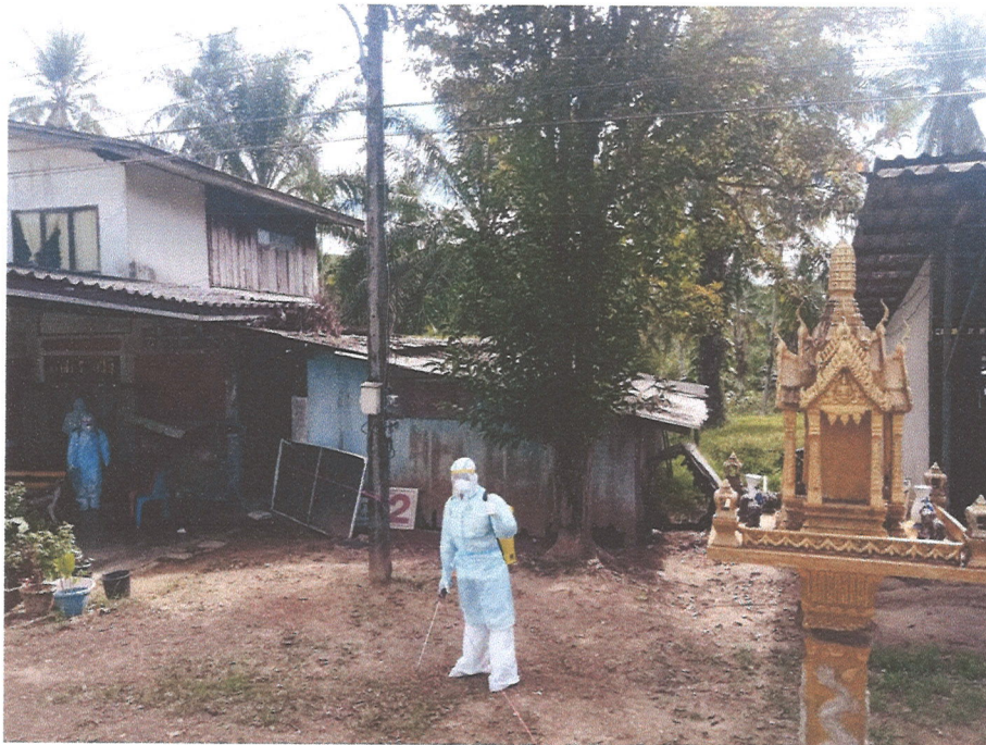
ภาพที่ ๔ ภาพการพ่นน้ำยาฆ่าเชื้อโควิด-๑๙