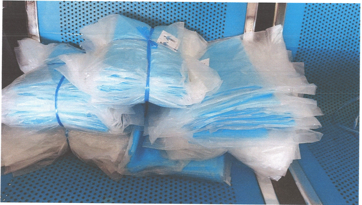
ภาพที่ ๗ ภาพชุดกันเปื้อน