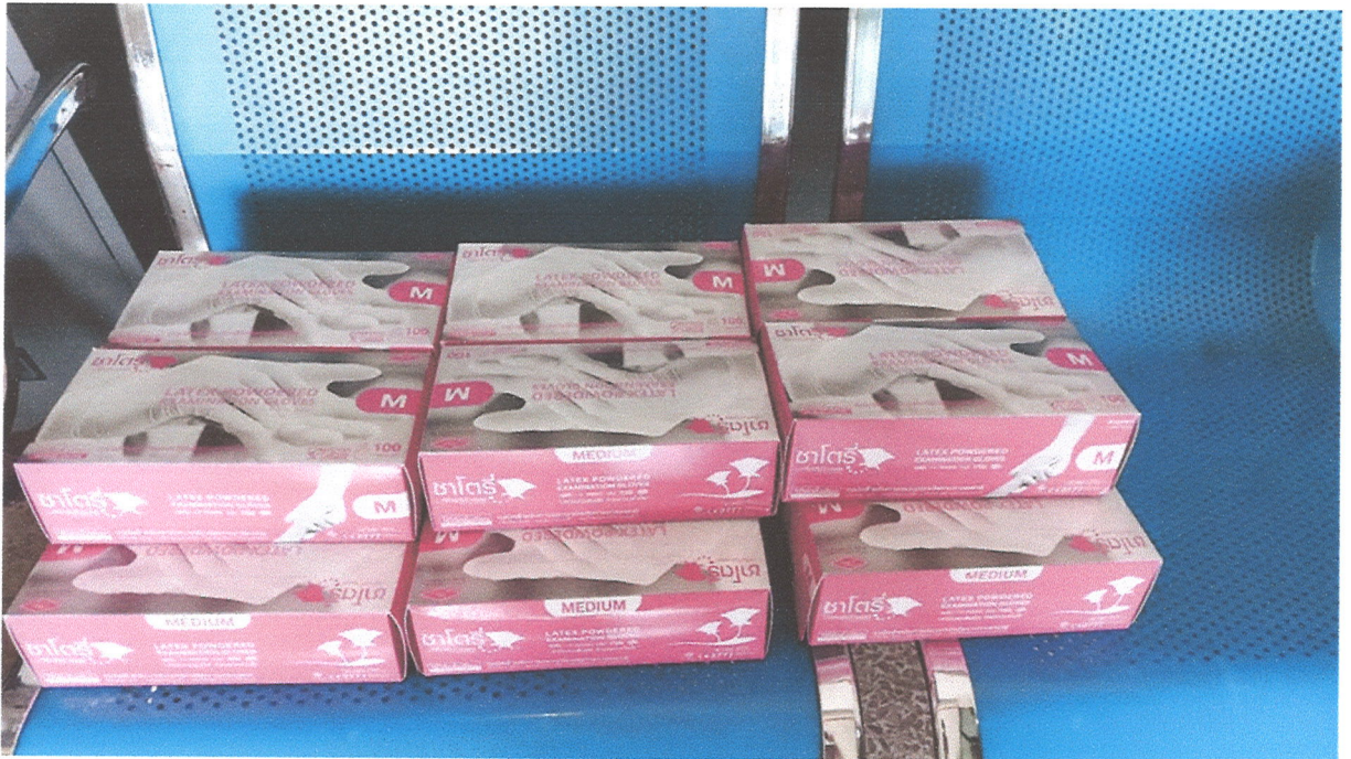
ภาพที่ ๑๒ ภาพถุงมือ