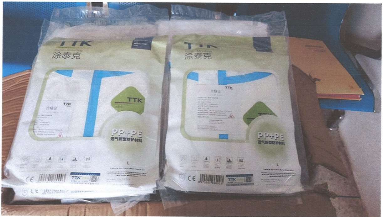
ภาพที่ ๑๐ ภาพชุดกันเปื้อน