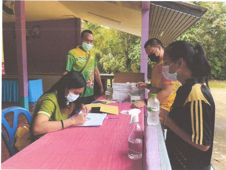
ภาพที่ ๓ การนำข้อมูลจากการสำรวจข้อมูลและขึ้นทะเบียนสัตว์มาลงพื้นที่ฉีดวัคซีน