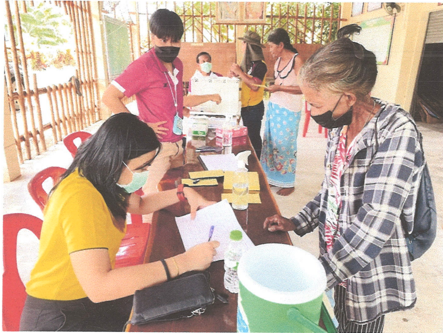
ภาพที่ ๑ การนำข้อมูลจากการสำรวจข้อมูลและขึ้นทะเบียนสัตว์มาลงพื้นที่ฉีดวัคซีน