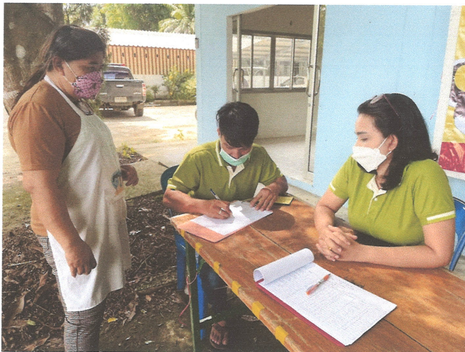
ภาพที่ ๔ การนำข้อมูลจากการสำรวจข้อมูลและขึ้นทะเบียนสัตว์มาลงพื้นที่ฉีดวัคซีน