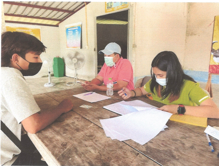
ภาพที่ ๒ การนำข้อมูลจากการสำรวจข้อมูลและขึ้นทะเบียนสัตว์มาลงพื้นที่ฉีดวัคซีน